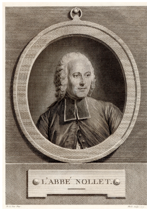
Fig. 4. Pasqual Pere i Moles. “Jean-Antoine Nollet”, en Galerie française... 1771. Bibliothèque nationale de France, París.

Otra de las colecciones de retratos que guarda similitudes con los planteamientos de Perrault y con la empresa española es la continuación de la Galerie française ou Portraits des hommes et des femmes célèbres qui ont paru en France , publicada en 1771 y cuyo segundo volumen estuvo a cargo del pintor Jean B. Restout. Al igual que en Les hommes illustres de Perrault, los retratos se presentaban de medio busto, en marco ovalado y sobre plinto, esta vez con una cartela donde se grababa el nombre del personaje (fig. 4) 24 . También se asemejaba al caso español la estructura de la serie, pues se vendía igualmente en cuadernos de seis sujetos procedentes de todos los campos, desde las artes y las ciencias a las armas o la religión, los cuales nunca podían ser de personas vivas. Por otro lado, en el prefacio de la obra también se avanzaba que “se decorará también de vez en cuando esta colección, con retratos de las mujeres más célebres, será una ocasión de rendir homenaje a sus gracias y bellezas” 25 , idea que parece que Rejón de Silva albergaba igualmente, pues se lo propuso a Floridablanca a finales del año 1791: “aun de mujeres se podía publicar también algún número, si V. E. no halla inconveniente” 26 . Es evidente que la propuesta no tuvo mucho éxito, a la vista del título definitivo que se dio a la serie: Retratos de Españoles Ilustres