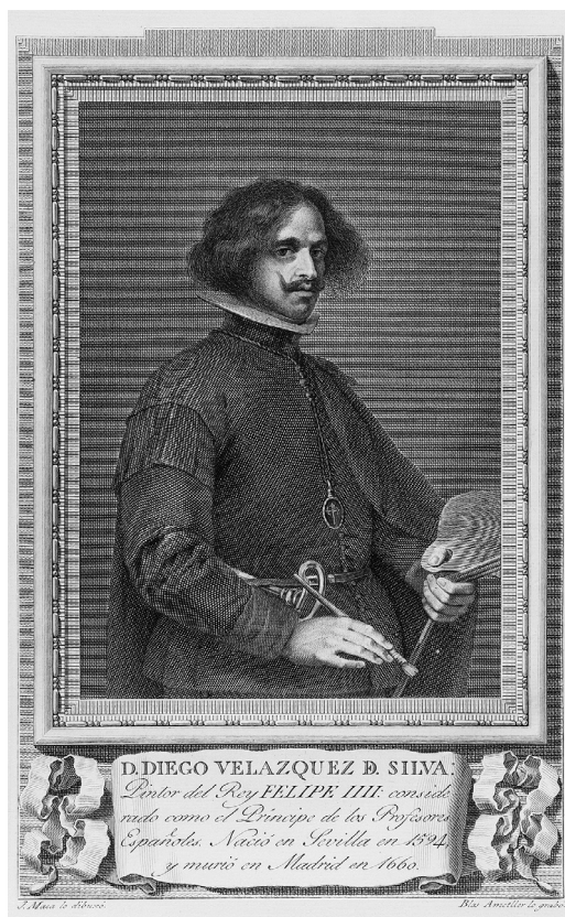
Fig. 12. José Maea (dib.) y Blas Ametller (grab.). “Diego de Velázquez”, Retratos de Españoles... 1798. Fundación Lázaro Galdiano, Madrid.

pañarlo” de forma voluntaria en torno a 1788, aunque dos años más tarde todavía no estaban claros los detalles que debían figurar en la cartela inferior de la estampa, ni si finalmente se imprimirían las hojas con el sumario biográfico. En 1790, el citado solicitaba a Floridablanca su dictamen sobre ambas cuestiones: