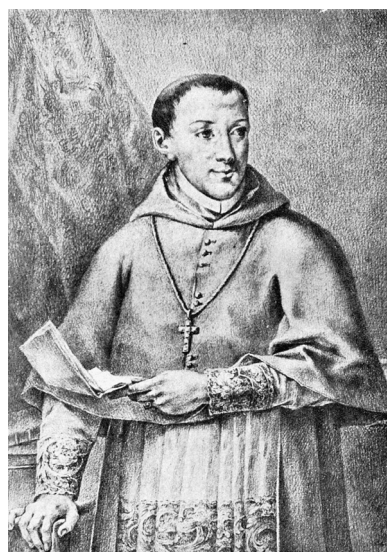
Fig. 10. José Maea. Dibujo para grabar del retrato de Juan de Palafox y Mendoza. 1792. Calcografía Nacional, Real Academia de Bellas Artes de San Fernando, Madrid.