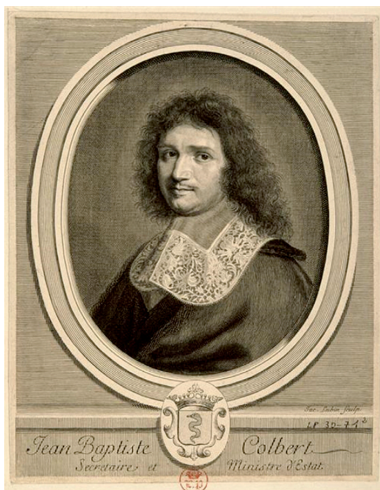
Fig. 3. Jacques Lubin. “Jean Baptiste Colbert”, en Perrault, 1697. Bibliothèque nationale de France, París.