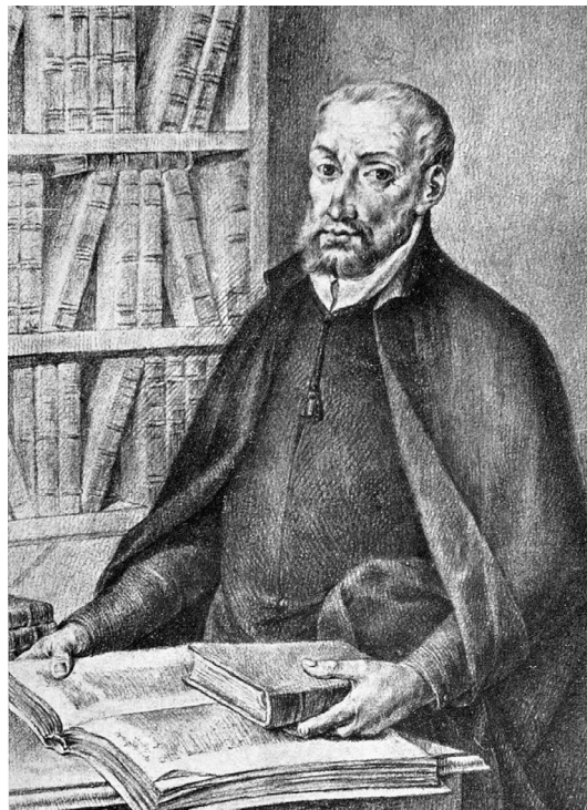
Fig. 7. José Maea. Dibujo para grabar del retrato de Juan Ginés de Sepúlveda . 1792-95. Calcografía Nacional, Real Academia de Bellas Artes de San Fernando, Madrid.

en el dibujo para grabar (fig. 10) 42 y en la estampa definitiva (fig. 11) 43 un cortinaje en la esquina superior izquierda, elemento muy utilizado en el periodo para subrayar la distinción de determinados sujetos; por eso no es de extrañar que, de todos los religiosos presentes en la serie, los cortinajes sólo figuren en los retratos de obispos y cardenales. En otros casos, se incorporaban pequeñas modificaciones desde pinturas originales, como sucede en el retrato de Diego de Velázquez (fig. 12), copiado del autorretrato original conservado entonces en la colección de Isabel de Farnesio y a quien se eliminaba la condición cortesana haciendo primar la artística al incorporar en su mano derecha la paleta y el pincel como expresión de la pintura 44 .