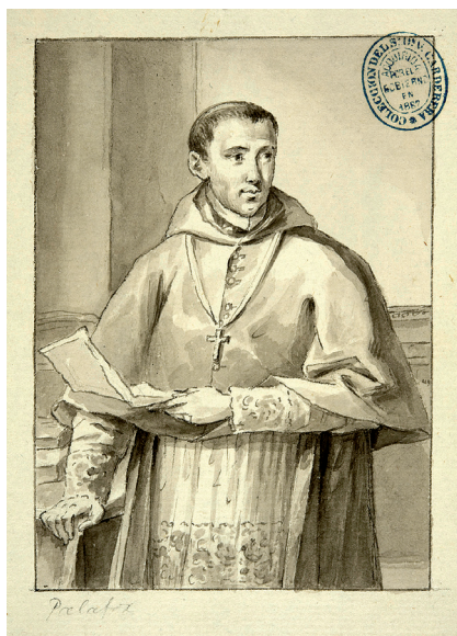
Fig. 9. José Maea. Dibujo preliminar del retrato de Juan de Palafox y Mendoza. 1792. Biblioteca Nacional de España, Madrid.

Otra de las causas que motivaron los retrasos fue la elaboración de las hojas impresas con el epítome de la vida del retratado, que debían acompañar a las estampas. A diferencia de los dibujantes, a quienes se pagó 440 reales por dibujo, y los grabadores, compensados con 3.000 reales por lámina, desconocemos en la actualidad la autoría de los primeros epítomes pues no consta documentación de pagos a tal efecto. Parece que Rejón de Silva encargó el trabajo de los primeros "a algunos amigos, capaces de desem-