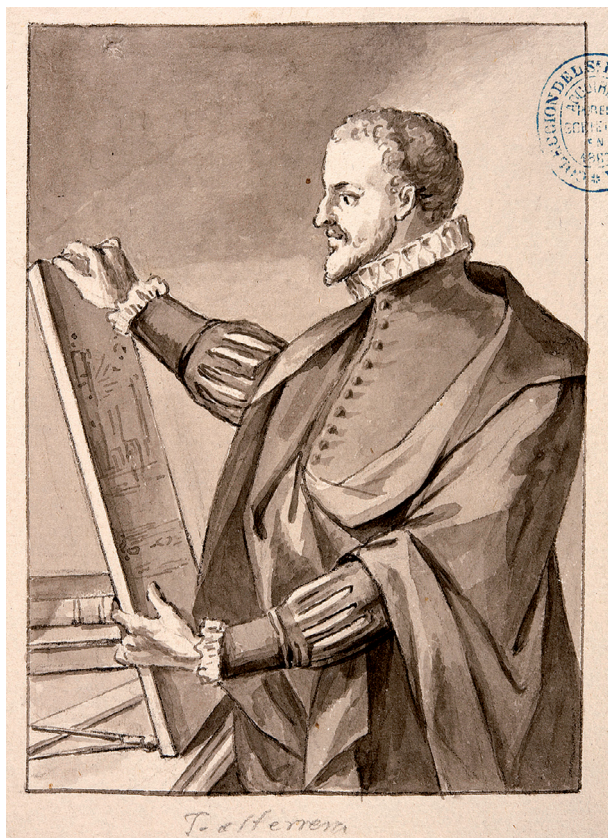
Fig. 5. José Maea. Dibujo preliminar del retrato de Juan de Herrera . ca. 1796. Biblioteca Nacional de España, Madrid.

“Las figuras deben tener un sitio donde sostenerse; deben vestirse; deben tener un fondo; debe haber luz y sombra; pero ninguna de tales cosas debería parecer haber ocupado la atención del artista. Deben tratarse de tal modo que no llamen siquiera la del espectador. Sabemos bien, al examinar una obra, la dificultad y sutileza con que un artista ajusta el fondo, su ropaje y las masas de luz; sabemos que una parte considerable de la gracia y efecto de su pintura depende de ellos; pero este debe estar tan escondido, aun para la vista de que discierne, que ningún resto de estas partes subordinadas acude a la memoria cuando no está presente la pintura” 37 .