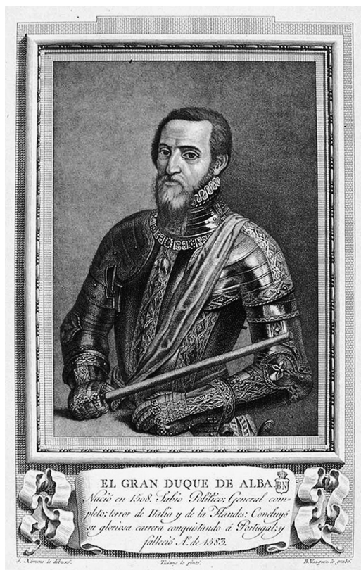
Fig. 1. José Ximeno (dib.) y Bartolomé Vázquez (grab.). “El Gran Duque de Alba”, en Retratos de Españoles... ca. 1791.