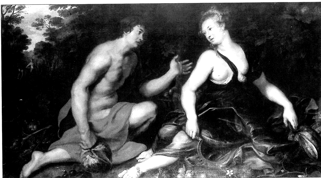
Fig. 1. Rubens y Snyders: Vertumno y Pomona . Colección particular.