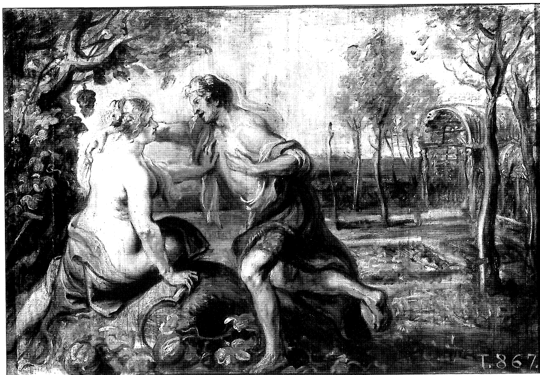
Fig. 2. Rubens: Vertumno y Pomona . Madrid, Museo del Prado.