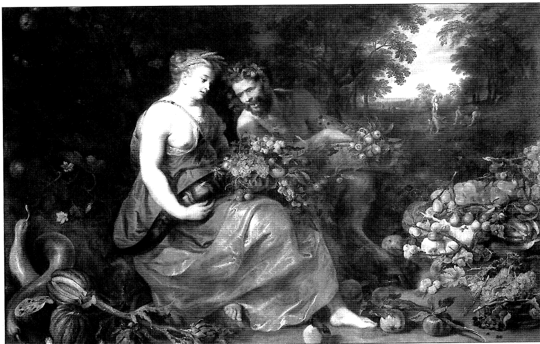
Fig. 3. Rubens y Snyders: Ceres y Pan . Madrid, Museo del Prado.