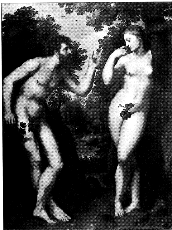
Fig. 4. Rubens: Adán y Eva . Amberes, Casa de Rubens.