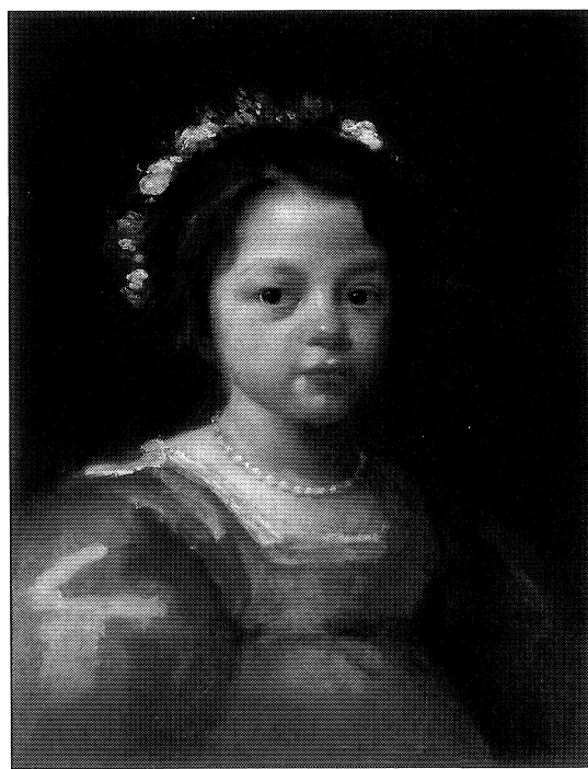
Fig. 1. B. Carducho: Estigmatización de San Francisco . Col. Apelles. Fig. 2. J. B. Martínez del Mazo: Retrato de niña . Col. Apelles.