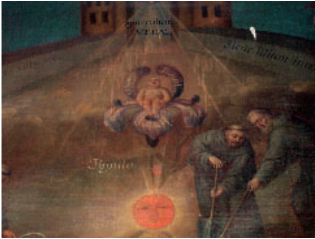
Fig. 4. “El misterio de la Inmaculada Concepción” (detalle: Sine Labe Virgo ). Armando Hernández Soubervielle (2009).