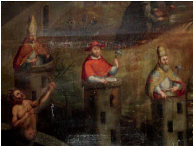
Fig. 5. “El misterio de la Inmaculada Concepción” (detalle: Triada eclesiástica). Armando Hernández Soubervielle (2009).