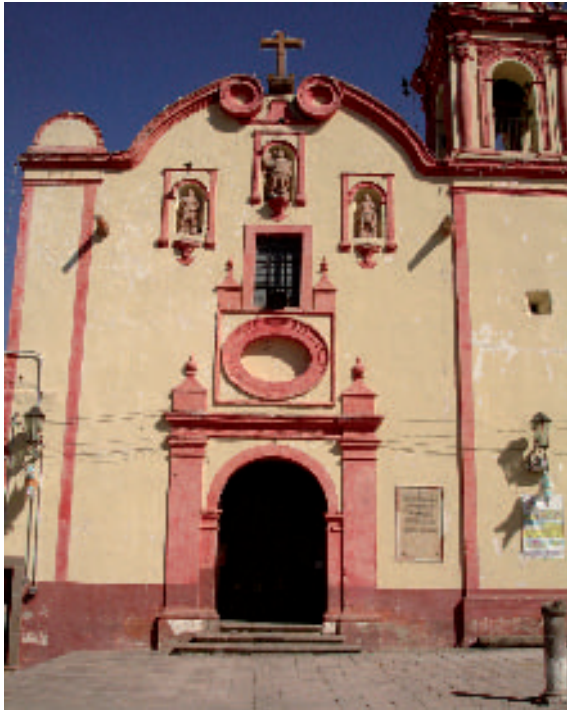
Fig. 1. Iglesia de San Miguel Arcángel, Mexquitic de Carmona, San Luis Potosí. Armando Hernández Soubervielle (2009).

El pueblo se fundó en 1591 bajo el nombre de San Miguel Mexquitic, acaso en honor del santo del capitán Caldera y porque, finalmente territorio de guerra, valía la pena encomendarlo a San Miguel Arcángel, líder de las milicias celestiales. Esta fundación de frontera estuvo influida desde el comienzo por la orden franciscana, ya que la zona pertenecía a la Provincia Franciscana de México, aunque algunos años después se fijaron sus límites eclesiásticos definitivamente dentro de lo que sería el obispado de Michoacán 3 .