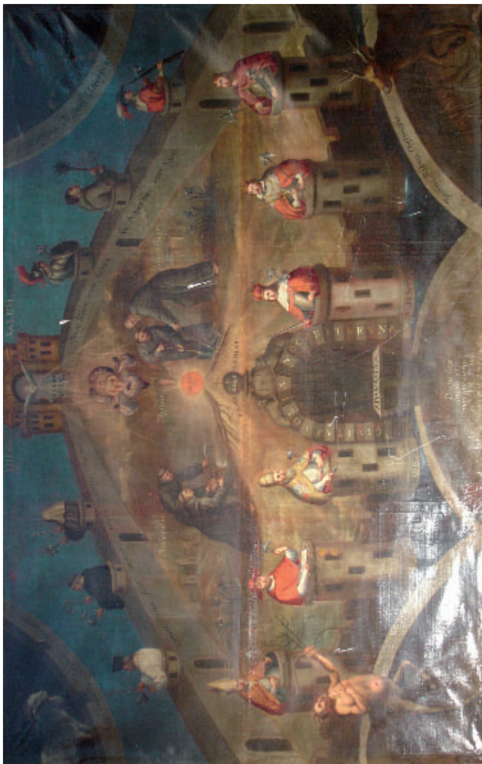
Fig. 2. Pedro López Calderón, "El misterio de la Inmaculada Concepción", Óleo sobre lienzo, México 1731. Sacristía de la iglesia de San Miguel Arcángel, Mexquitic de Carmona. Fotografía: Armando Hernández Soubervielle (2009).