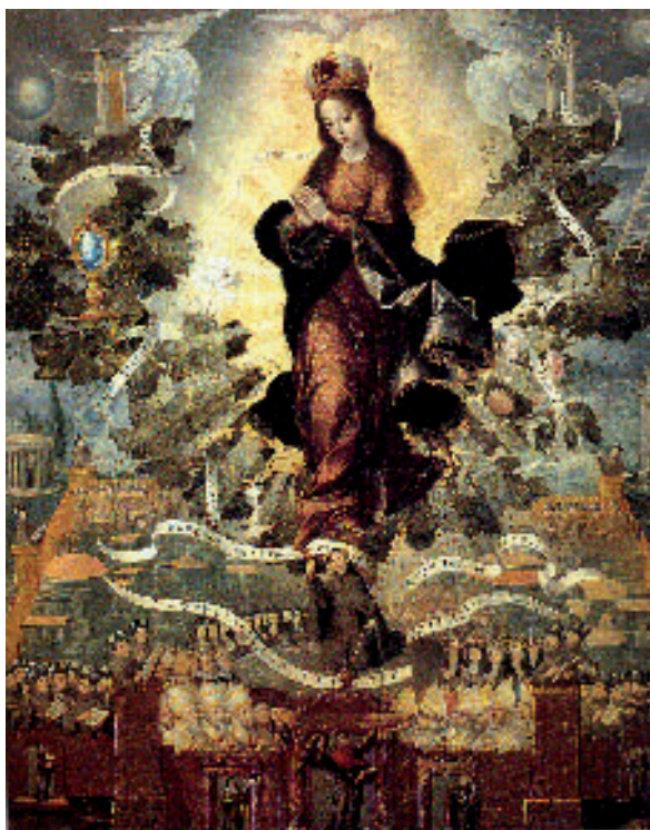
Fig. 7. Basilio de Salazar, Exaltación franciscana de la Inmaculada Concepción , 1637, Museo de Arte de Querétaro (México).

No obstante que la advocación de la Inmaculada Concepción no era un dogma de fe respaldado por el Vaticano 82 , los franciscanos principalmente, difundieron su devoción no sólo en Europa sino que la tomaron como estandarte para las misiones allende el mar. En la Nueva España la imagen de la Inmaculada tuvo, gracias al celo misional de la orden seráfica, una rápida acogida entre los naturales de los pueblos, muy al margen de las discusiones teológicas que se estaban llevando a cabo en el papado sobre la formulación dogmática de la concepción sin mácula de la Virgen María 83 . La advocación de la Inmaculada Concepción se remonta a los primeros años de la conquista, de hecho para Santiago Sebastián la festividad de la Inmaculada fue una de las más importantes que tuvo el mundo novohispano, a cuyo honor se dedicaron procesiones, polémicas de carácter universitario y de forma muy prolija, obras pictóricas, siendo una de las más importantes la de Basilio de Salazar 84 que ya hemos comentado. Para el caso de San Luis Potosí, una de las fiestas más importantes era la de la Inmaculada, patrona jurada de la ciudad, de la cual se dice en documentos antiguos que no se halla su origen ya que se celebra desde que era pueblo 85 , lo cual confirma la temprana llegada de esta advocación a tierras potosinas, jurándose incluso en los actos y contratos de algún cargo público. La pintura El misterio de la Inmaculada Concepción se relaciona con Mexquitic desde diferentes