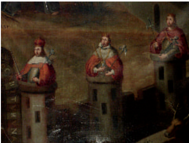
Fig. 6. “El misterio de la Inmaculada Concepción” (detalle: Triada real). Armando Hernández Soubervielle (2009).