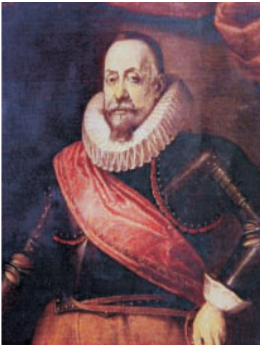
Fig. 1. Retrato de Pedro de Toledo, V marqués de Villafranca. Colección particular.

tes en el siglo XVII de esta nobleza, nombres a los que podríamos añadir el de Pedro de Toledo, V marqués de Villafranca del Bierzo, II duque de Fernandina y príncipe de Montalbán, nieto del famoso virrey de Nápoles del mismo nombre (fig. 1).