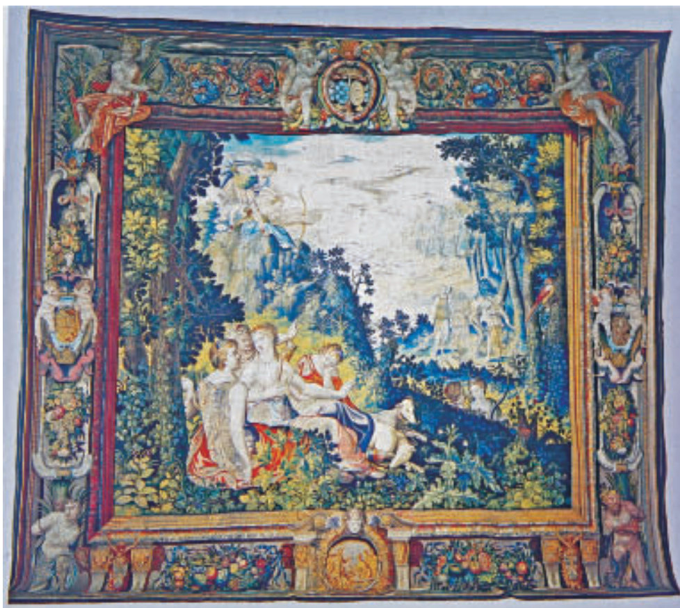
Fig. 3. Tapiz de “Diana con sus ninfas descansando en el bosque”, Historia de Diana . Patrimonio Nacional, Madrid.