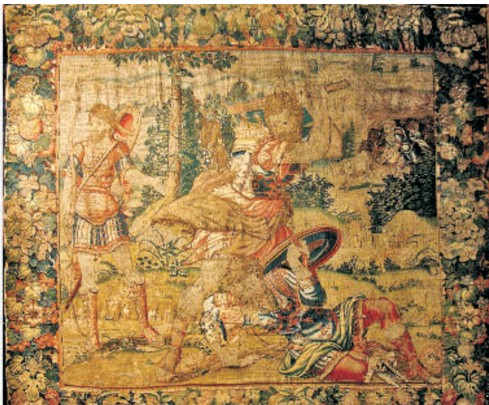
Fig. 6. Tapiz de la Historia de Sansón . Ayuntamiento de Ávila.

la derecha, que representa a Sansón atando una tea a la cola de las zorras, permite identificar el tema.