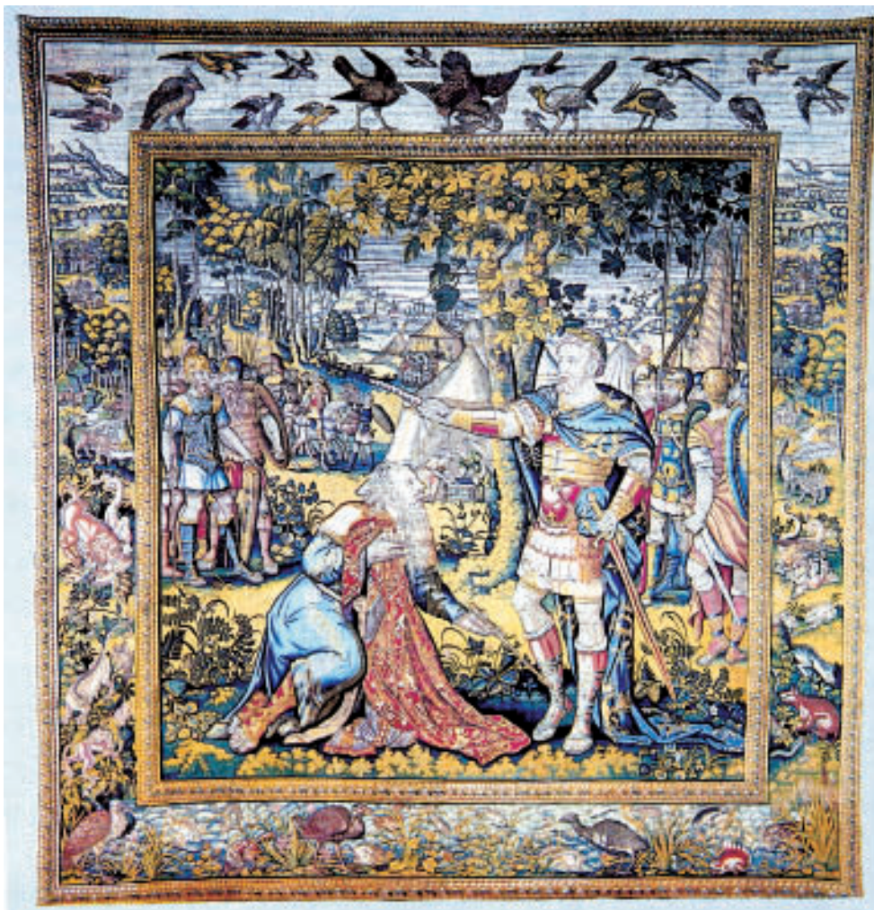
Fig. 5. Tapiz de “Octavio rehúsa las insignias de la soberanía”, Historia del emperador Octavio . Patrimonio Nacional, Madrid.

retiro n.º 5-----Tapicerías de 390 años a 60 reales-----23.400 reales” 37 . Esta compra de García de Haro y Avellaneda, que era el que tomaba las decisiones en cuanto a la adquisición de tapices para el Retiro, parece ser la tapicería que en la tasación se describe como “...fina de Bruselas de la historia de Marco Antonio y Cleopatra con la cenefa alta de bolatería que tiene diez paños...” 38 . Descripción que se corresponde con la serie 51 de Patrimonio Nacional, identificada actualmente como la Historia del emperador Octavio (fig. 5), pero que en los inventarios palatinos en los que aparece a partir de la muerte de Carlos II (1700) es denominada como Historia de Marco