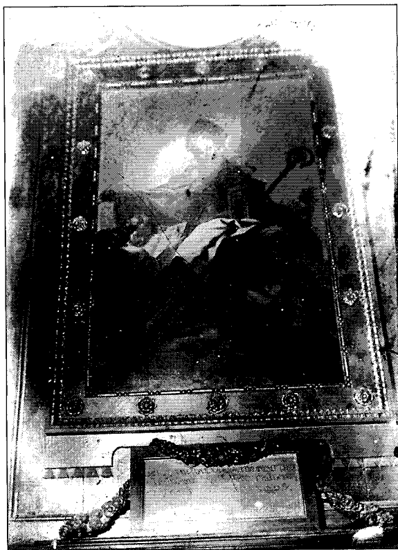
Fig. 13. Retablo de San Agustín. Detalle.