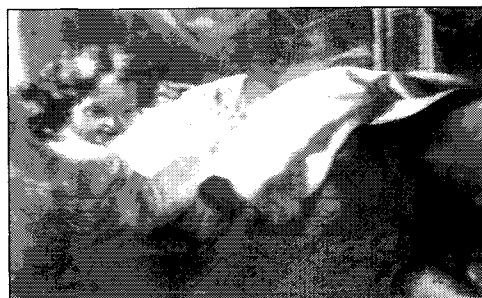
Fig. 14. Detalle de la pintura del retablo de San Agustín.