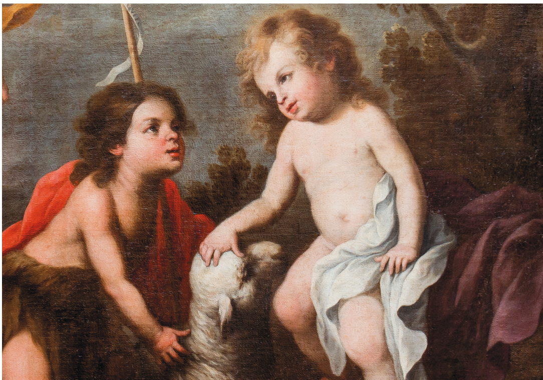
Fig. 6. Francisco Pérez de Pineda. Niño Jesús y San Juanito con el cordero (detalle). 1693. Hermandad del Silencio, Sevilla.

infantes, del característico atributo del Bautista: la cruz con la filacteria del Ecce Agnus Dei , tendida sobre un peñasco [fig. 5].