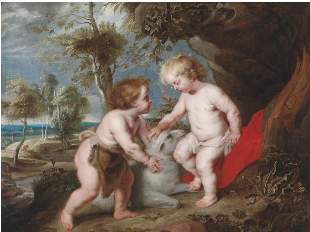
Fig. 3. Pedro Pablo Rubens y taller. Niño Jesús y San Juanito en un paisaje. c. 1630.