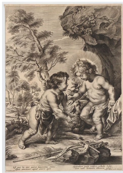
Fig. 5. Grabado de Gaspar Huberti sobre composición de Pedro Pablo Rubens. Niño Jesús y San Juanito jugando con el cordero . Tercer cuarto del siglo XVII.