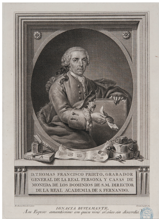
Fig. 1. Antonio González Ruiz, Retrato de Tomás Francisco Prieto . Biblioteca Nacional de España (IH/7470-1).