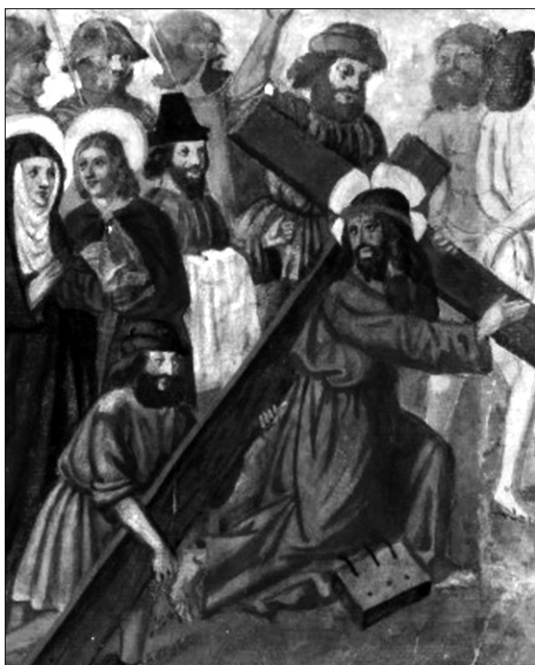
Fig. 3. Speculum animae (París, Biblioteca Nacional, ms. Esp. 544, fol. 33r). Cristo con la cruz a cuestas. Principios del s. XVI.