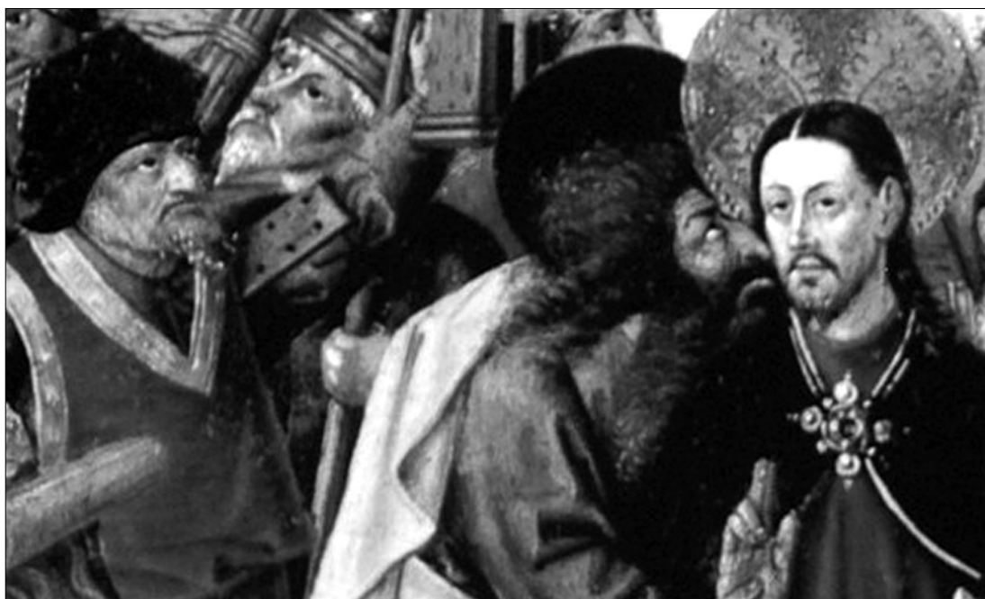
Fig. 3. Joan Reixac. El beso de Judas. Predela del retablo de la institución de la Eucaristía (Valencia, Museo de Bellas Artes).