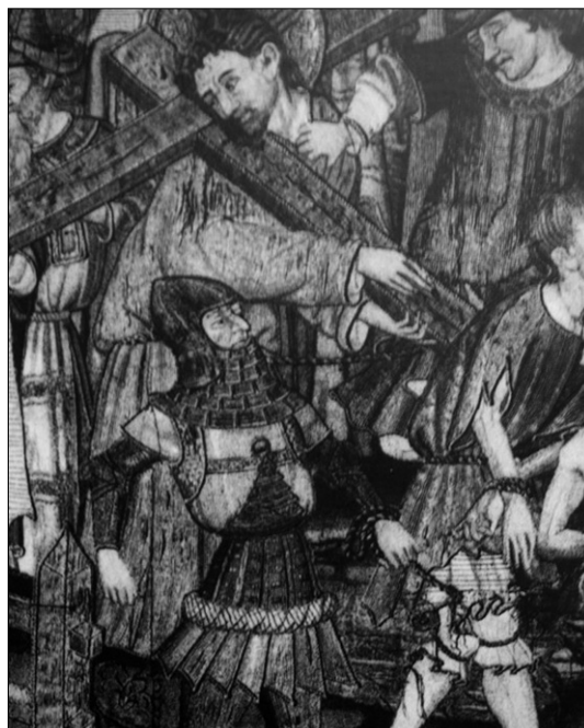
Fig. 2. Frontal de la Pasión. Cristo con la cruz a cuestas. Desaparecido en 1936 (hasta esa fecha en la catedral de Valencia). Hacia 1440-1450.