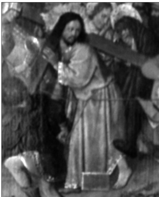
Fig. 1. Luis Alimbrot. Tríptico de los Roiç de Corella. Detalle de la tabla central. (Madrid, Museo del Prado). Hacia 1440-1450.