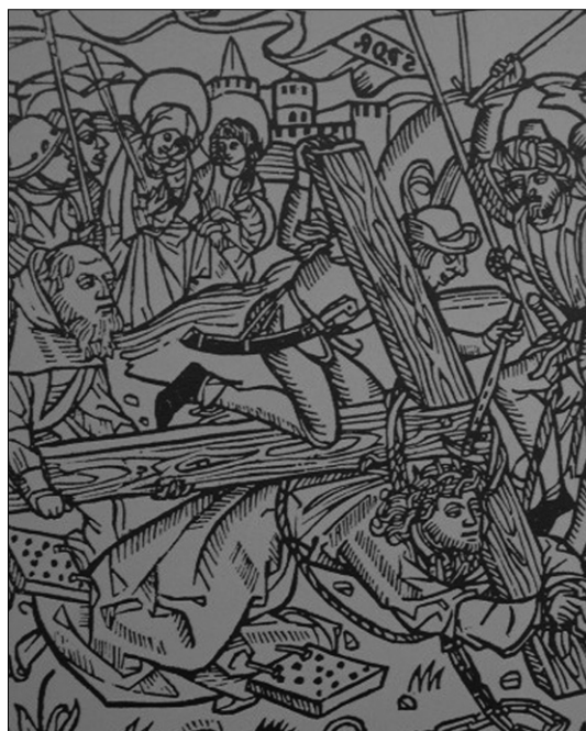
Fig. 4. La quinta caída Xilografía alemana (ca. 1480).