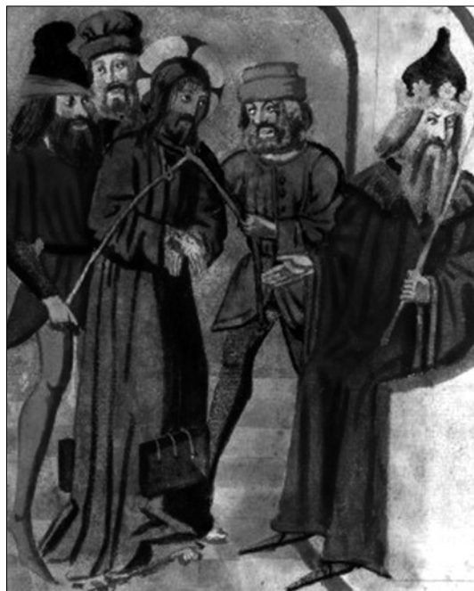
Fig. 6. Speculum animae (París, Biblioteca Nacional, ms. Esp. 544, fol. 19r). Cristo ante Herodes. Principios del s. XVI.